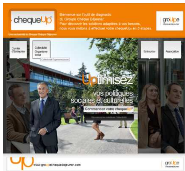
Site Internet Chèque Up www.cheque-up.fr