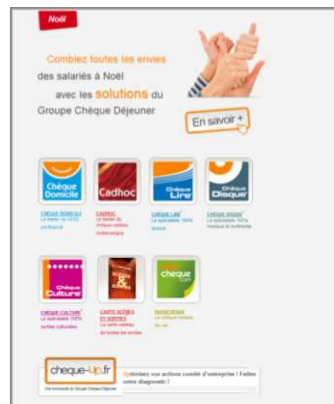
E-mailing de Noël

Une cible captive utilisant déjà nos titres de paiement